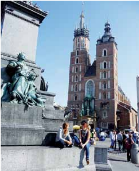
Marienkirche in Krakau

sich in der Spannung zwischen vom Krieg weitgehend verschonten Städten wie Krakau und durch den Krieg zerstörten Städten wie Breslau oder auch Ratibor. Diese, wiederaufgebaut, erinnern teilweise an die Architektur der aus dem Boden gestampften Stadtteile in unseren östlichen Bundesländern. Der Tourist aber vermisst nichts, an das er sich durch langjährige Konsumfreudigkeit gewöhnt hat, ausgenommen die hohen Preise, die er selbst in Polens Großstädten bei Essen, Trinken und Eintritten (noch) vergessen darf.