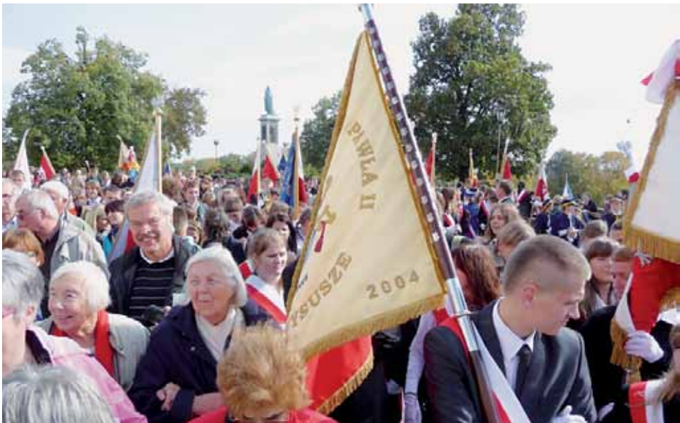
Eine Pilgergruppe zieht in Tschenschow ein

kann man lernen, dass etwa Papst Johannes Paul II nicht nur Oberhaupt der Katholiken war, sondern auch maßgeblich Einfluss auf die politische Orientierung und Umgestaltung in Polen gegen Ende des letzten Jahrhunderts ausgeübt hat. (Der Einfluss der Kirche auf die Politik in Polen geht allerdings inzwischen deutlich zurück.) – Man findet in Dörfern und Städten allüberall Kirchen; und diese sind zu den Gottesdienstzeiten stark besucht und in ihnen verweilen und beten auch außerhalb der Gottesdienste viele Gläubige. Religiöse Darstellungen auf Bildern oder Skulpturen wie auch Liedertexte oder Betrachtungen auf Gebetszetteln oder auf Anschlägen in den Kirchen muten uns teilweise befremdlich an. Und wir dürfen (mit Respekt und auch Stolz) darauf hinweisen, dass