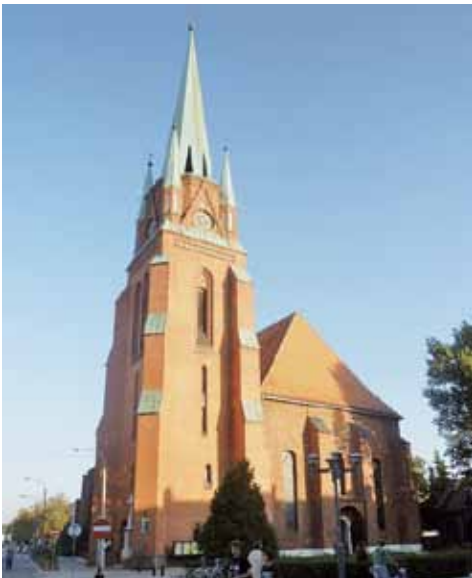
Kirche unserer Partnergemeinde