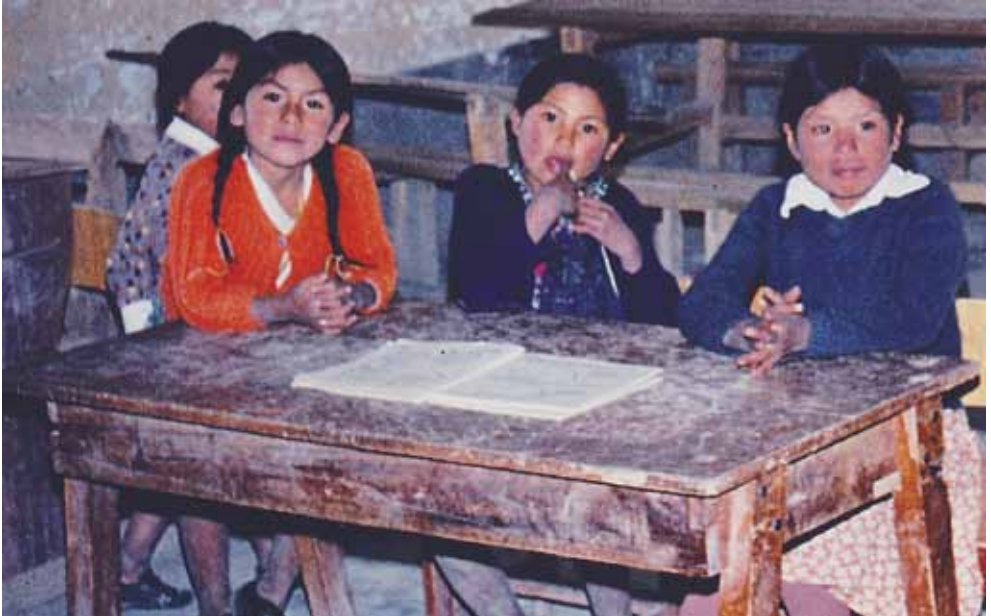
Indiomädchen in einer armen Dorfschule

Dies bedeutet einen großen Fortschritt und eine Hoffnung für mich und die Gläubigen. Dennoch bleiben einige Pfarreien ohne eigenen Priester. Jede Pfarrgemeinde umfaßt ein sehr großes Gebiet mit vielen Dörfern und Kapellen. In einigen sehr weit entfernten Ortschaften kam der letzte Priester vor zehn oder fünfzehn Jahren vorbei. Diese Situation bereitet mir weiterhin Sorge.