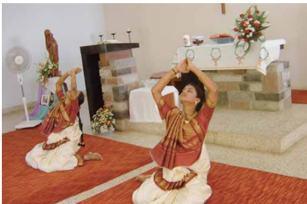
Die Messe gestalten sie mit indischem Tanz