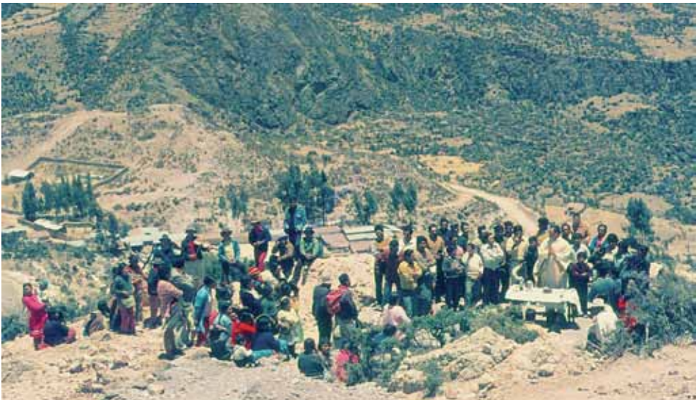
Bergmesse in den Anden bei Puquio